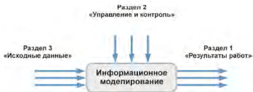
Рисунок 2 - Обзор разделов основополагающих принципов в процессе информационного моделирования

В разделе, посвященном результатам работ, должны быть приведены указания по составлению технических требований к желаемым результатам работ.