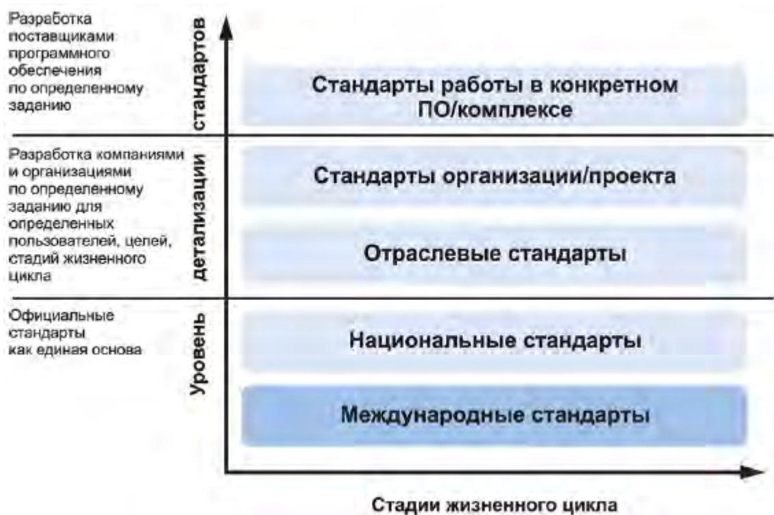
Рисунок 1 - Сферы применения стандарта информационного моделирования

- содействие применению официальных положений договоров, касающихся применяемых стандартов информационного моделирования.